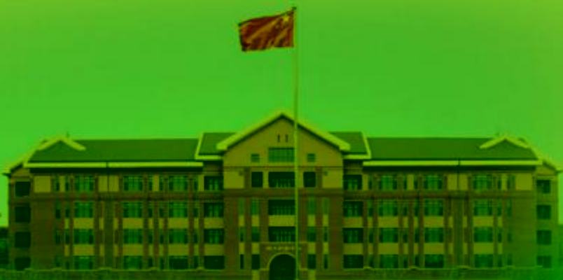
天津机电职业技术学院

TIANJIN VOCATIONAL COLLEGE OF MECHANICAL AND ELECTRICAL ENGINEERING